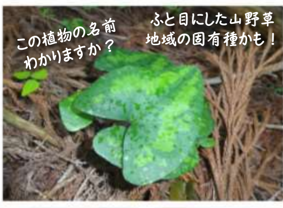
この植物の名前わかりますか？ ふと目にした山野草 地域の固有種かも！

九州北西部の丘陵や山で木の下などに生えている「ツクシアオイ」は絶滅危惧Ⅱ類種です。「ストップ温暖化」事務局では県内の絶滅危惧種の植物をまとめた「レッドデータブックさが2010」を販売しています。お手元で是非ご活用ください。 ●販売価格：2,000円(送料・税込み)