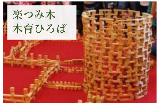
楽つみ木 木育ひろば

毎年大人気の「楽つみき」や木育ひろばでは、幼児から大学生まで、様々な年齢の方が、木のおいや音・手触りを全身で体感し、子供たちの創造性や協調性を育みます。また、森林の役割や、木がどのようなところで使われているかなど、お話を聞いて質問をしたり、意見を出し合い考える事で、難しい地球環境や温暖化についても、遊びながら学習できます。積み木のシャワーや全員で作る作品など、たくさんのつみ木を使った普段できない体験に、歓声が上がります。※今年度はソーシャルディスタンスを保って一人一人で作品作りをします。