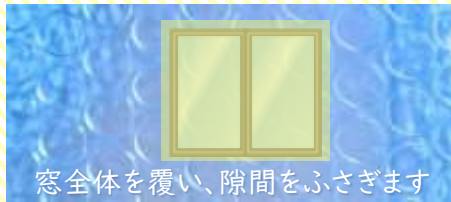
窓全体を覆い、隙間をふさぎます

窓枠いっぱい、隙間なく緩衝シートを貼ると驚くほどひんやりがなくなります。画びょうやテープで取付けOK！