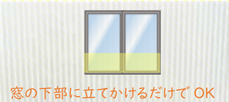
窓の下部に立てかけるだけでOK