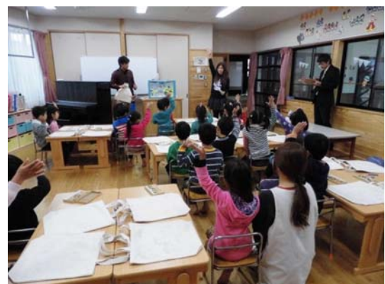
▲「同朋天神保育園エコクラブ」(有田町)でのエコバッグづくり