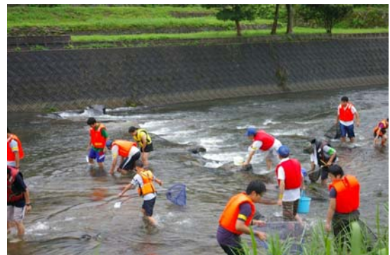
▲「夏休みリバーズクール」(巖木川)での水生生物調査