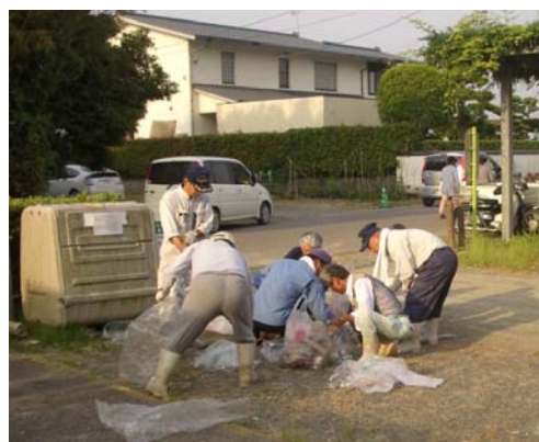
▲ふるさと美化活動(上峰町)