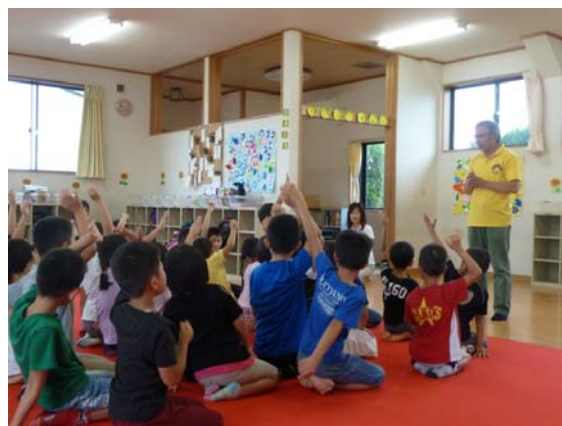
▲「三日月第1・第2放課後児童クラブ」での環境学習会